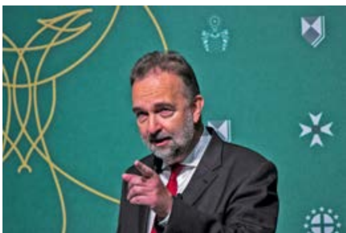
Nagovor Karla von Habsburga o prihodnosti Evrope